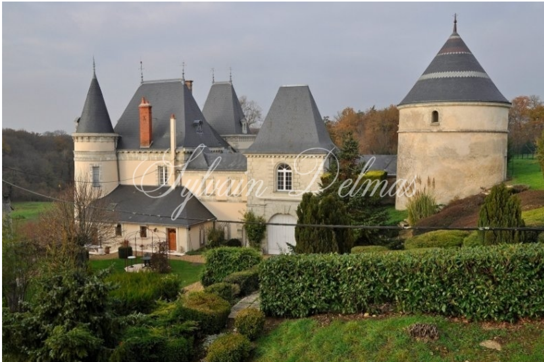
SAINT-PATERNE-RACAN, Indre-et-Loire, FRANCE