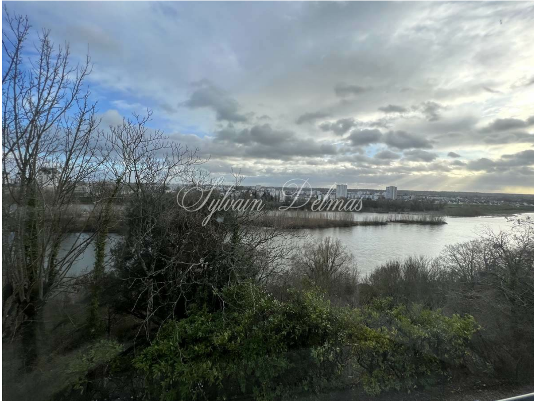
TOURS, Indre-et-Loire, FRANCE