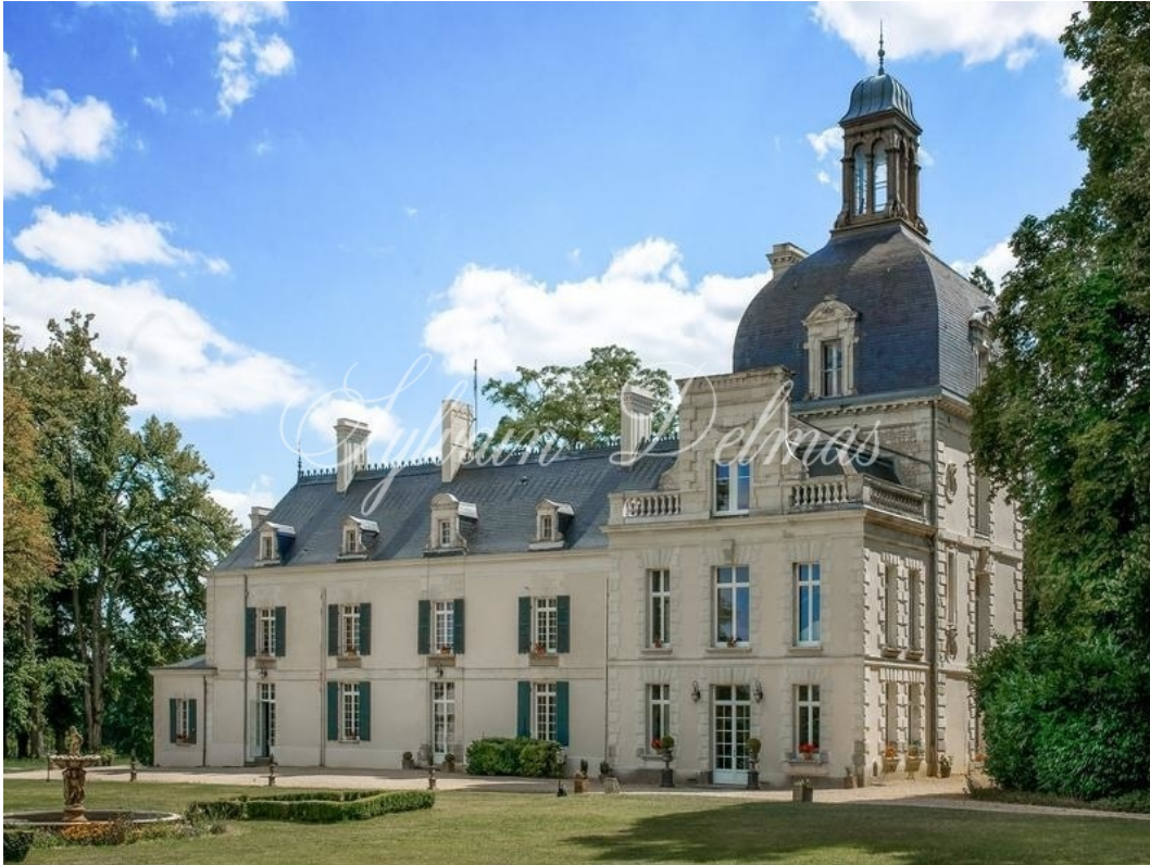
RICHELIEU, Indre-et-Loire, FRANCE