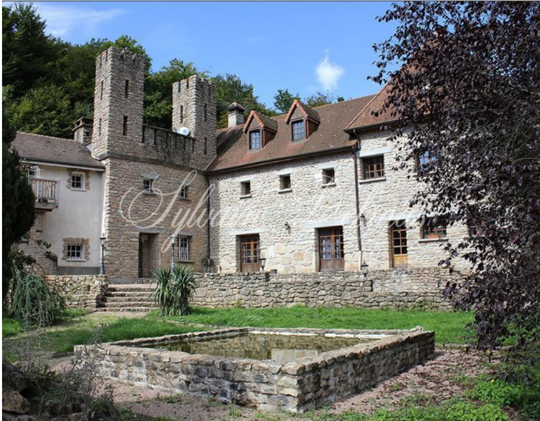
MONTCEAU-LES-MINES, Saône-et-Loire, FRANCE 1 200 000 €