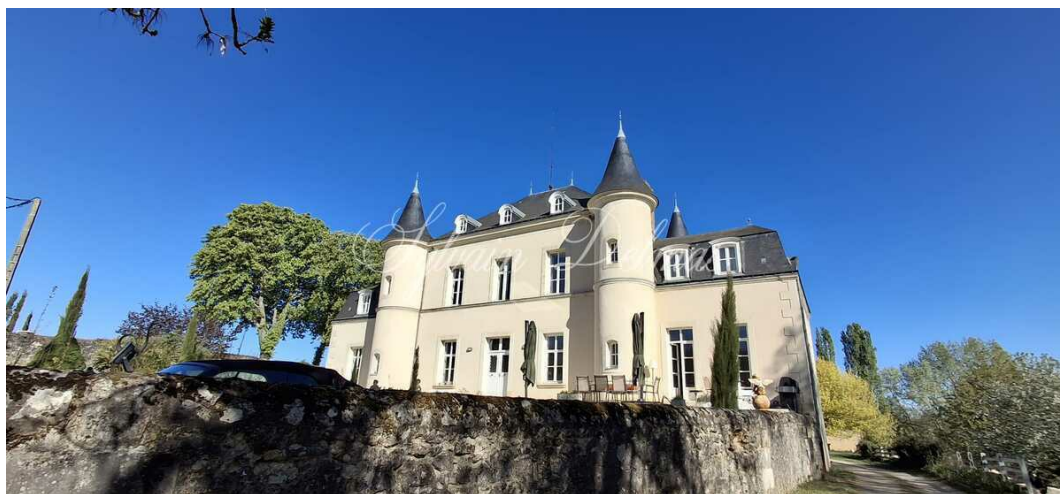
BEAUMONT-LA-RONCE, Indre-et-Loire, FRANCE 950 000 €