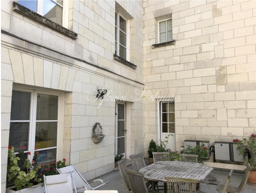
TOURS, Indre-et-Loire, FRANCE 1 360 000 €