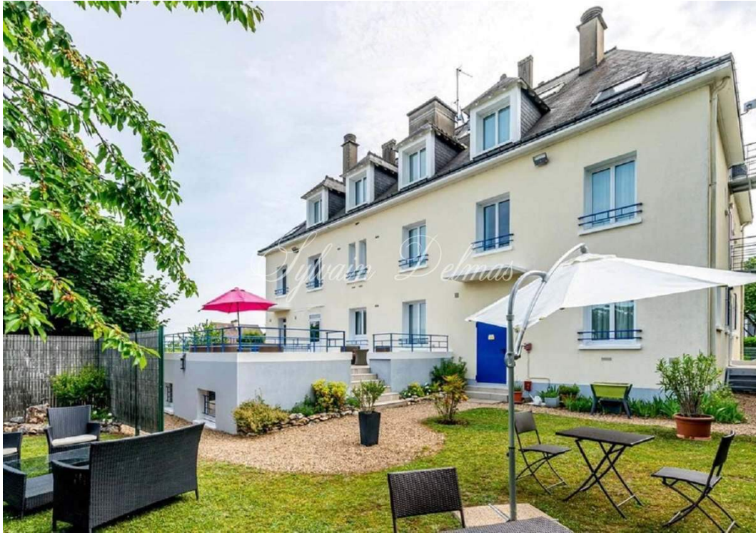
TOURS, Indre-et-Loire, FRANCE 2 530 000 €