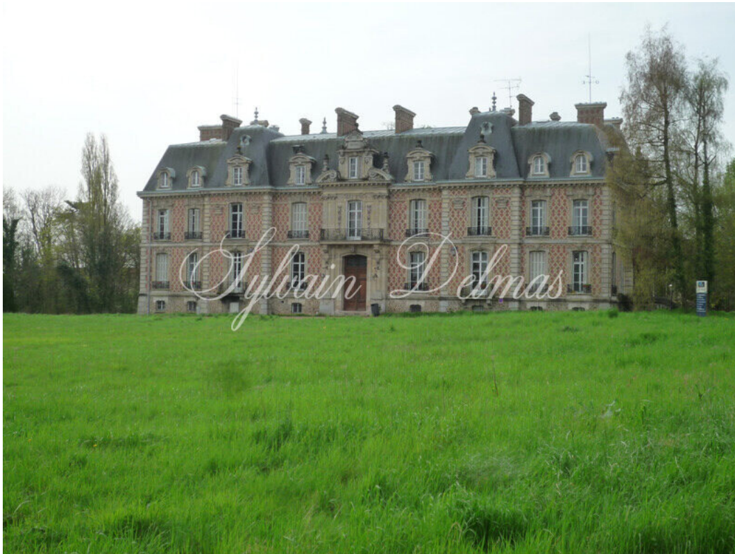
JOUARRE, Seine-et-Marne, FRANCE 2 100 000 €