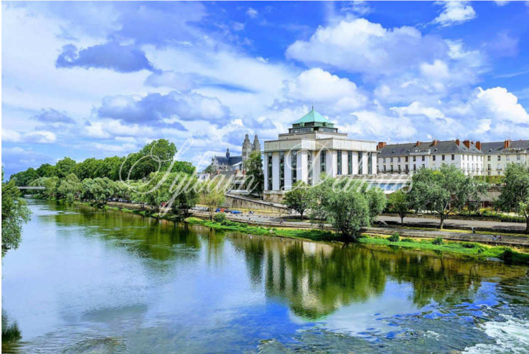
TOURS, Indre-et-Loire, FRANCE 3 500 000 €