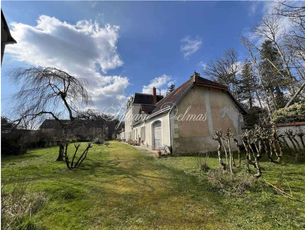
CHÂTILLON-SUR-INDRE, Indre, FRANCE 590 000 €