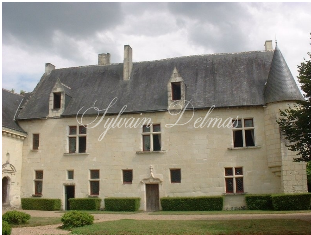
TOURS, Indre-et-Loire, FRANCE