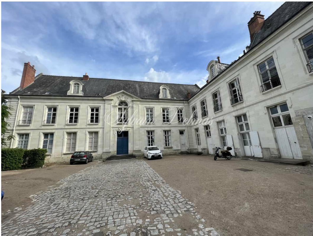
TOURS, Indre-et-Loire, FRANCE 380 000 €