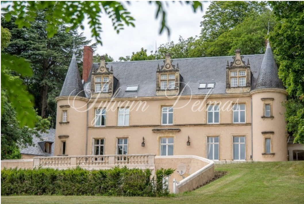
TOURS, Indre-et-Loire, FRANCE 2 200 000 €