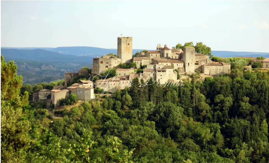
AUBENAS, Ardèche, FRANCE 1 861 000 €